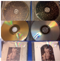
※金メッキ盤と通常盤の聴き比べ

今回のテーマは耳ソムリエという事で会場には4種類のヘッドホンが用意され、各機種の聴き比べを参加者に体験してもらい、CDも金メッキ盤と通常盤の聴き比べを体験してもらい、違いを楽しんでもらうという、まさにどうでも良い人にとってはどうでも良い内容の体験コーナーですが、意外や意外で集まったお客様はかなり楽しんでくださったようでした。