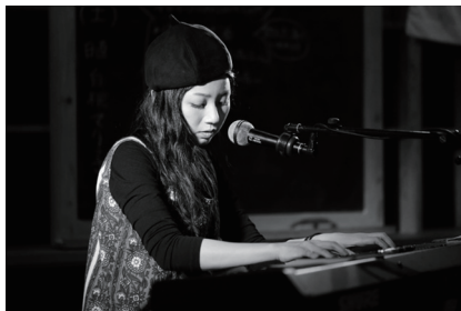
※モノクロがチョー渋い