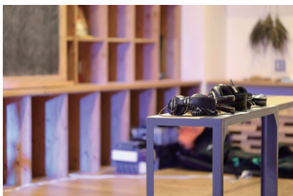
※鎮座まします4種 + ケーブル違いの5台のヘッドホン