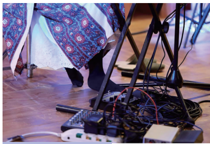
※マリ子のライブ新兵器

マリ子さんが大好きなアーティスト「KT・タンストール」がライブで愛用するルーパーと同じ機種を初チャレンジ!